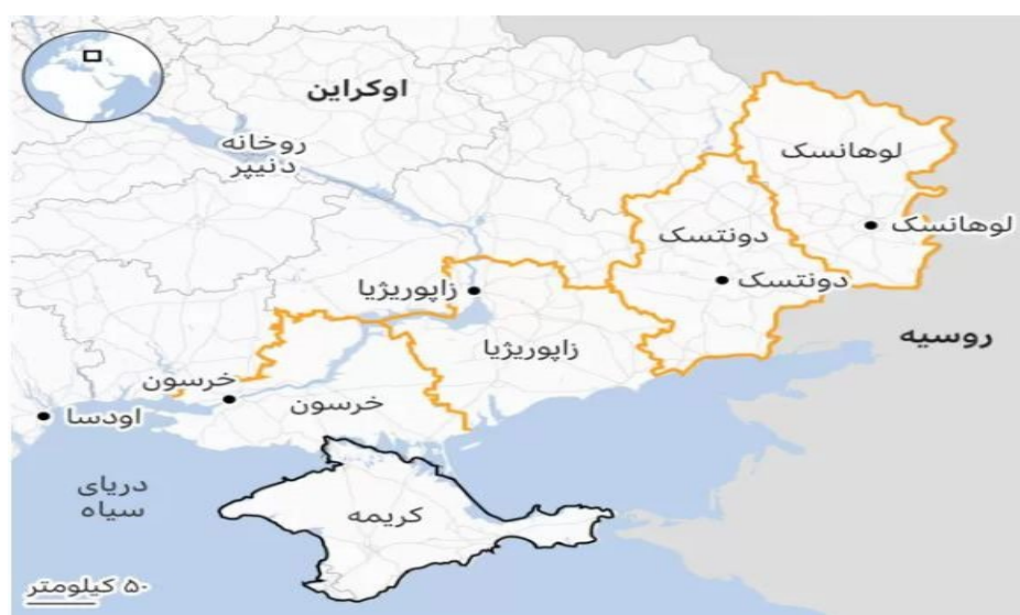
تصویر ۱. مناطق الحاق شده به روسیه

غربی و خصوصا ناتو بهره می‌برد. دوم با توجه به وسعت یکتای فدراسیون روسیه و عدم نیاز ظاهری این کشور به الحاق سرزمین‌های جدید، از بعد اقتصادی و سیاسی به نظر می‌رسد تلاش برای الحاق چهار منطقه از خاک اوکراین احتمالا از بعد اجتماعی و امنیتی برای رهبران روسیه رجحان داشته باشد. جامعه روسیه علیرغم پیشرفت‌های قابل توجه از زمان روی کارآمدن آقای پوتین در ۲۰۰۰ از وضعیت این کشور راضی نبوده است. سطح رفاهی مردم افزایش یافته اما سطح توقعات بیشتر شده است. دامن زدن به ناسیونالیسم روسی و تظاهر به موفقیت در این زمینه شاید بتواند هزینه‌های وسیع و متعدد جنگ را توجیه کند. سوم از لحاظ امنیتی ممکن است اقدام روسیه بتواند علامتی برای دیگر کشورهای همسایه روسیه در اروپای مرکزی و شرقی برای تبری جستن از هر گونه نزدیکی به پیمان‌های نظامی همچون ناتو باشد. نکته قابل تامل اما به سخنرانی پوتین در مراسم الحاق مناطق یادشده باز می‌گردد. رییس‌جمهور روسیه کیف را شروع‌کننده جنگ از سال ۲۰۱۴ خواند و از آمادگی برای مذاکره با اوکراین با هدف توقف جنگ خبر داد. اظهارنظری که بنظر می‌رسد نشانگر رضایت نسبی پوتین نسبت به نتایج کنونی جنگ بوده و شاید سیگنال مثبتی برای خاتمه این تنش بشمار آید. در همین راستا خبرگزاری مستقل Readovka چهارشنبه گزارش داد، ولادیمیر پوتین، رئیس‌جمهور روسیه ممکن است درباره "تغییر وضعیت عملیات ویژه" در اوکراین اعلامیه صادر کند. درمقابل زلنسکی رییس‌جمهور اوکراین با امضای قانون عدم مذاکره با پوتین دست رد به پیشنهاد پوتین داد.