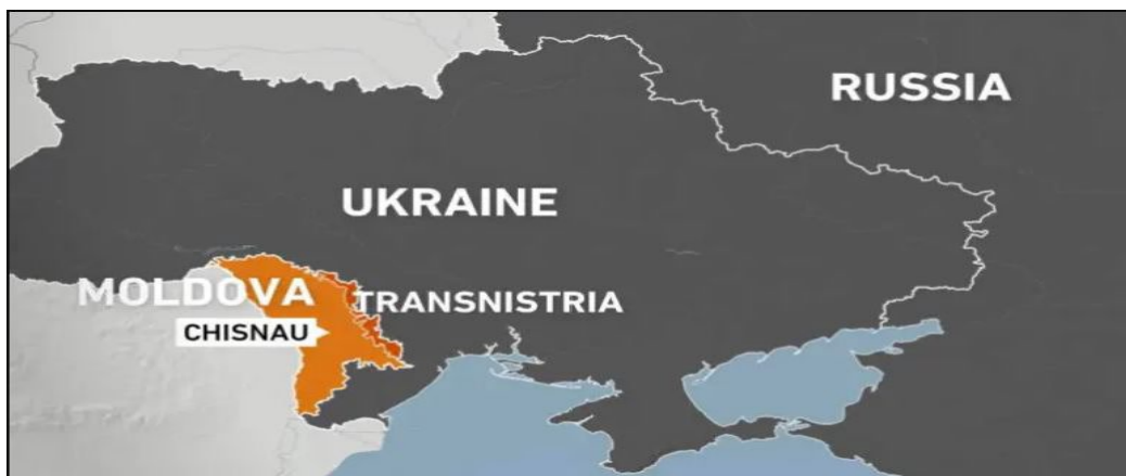
شکل ۱. نقشه موقعیت ترانسنیستریا در شرق مولداوی

ایگور ژوکوا، معاون رئیس دفتر ولودیمیر زلنسکی، با اشاره به مواضع یک مقام ارتش روسیه در خصوص تهاجم به منطقه «ترانسنیستریا» در شرق مولداوی، اعلام کرد: احتمال چنین تهاجمی زیاد است. به گزارش «نیوزویک»، رستم مینکایف، معاون فرمانده منطقه نظامی مرکزی روسیه، حدود دو ماه پیش گفته بود که کرملین بنا دارد به عنوان بخشی از استراتژی ایجاد کریدور زمینی به کریمه، که مسکو در سال ۲۰۱۴ آن را ضمیمه خاک روسیه کرده، منطقه جدایی طلب «ترانسنیستریا» در شرق مولداوی را از طریق کریدوری زمینی در جنوب اوکراین به شبه‌جزیره کریمه متصل کند. اظهاراتی که نشان می‌دهد پوتین بدنبال ایجاد دیوار استراتژیک بین خود و اروپاست و عوامل سیاسی اثرگذار بر بازارها از جمله بازار انرژی را افزایش می‌دهد. ترانسنیستریا در واقع منطقه‌ای با رسمیت محدود بوده و شامل دولتی است که از سوی همه دولت‌ها و همچنین سازمان ملل متحد به رسمیت شناخته نمی‌شود. در مارس ۲۰۱۴ پارلمان ترانسنیستریا رسماً از روسیه درخواست کرد که اجازه داشته باشد مانند کریمه به فدراسیون روسیه ملحق شود و روسیه در پاسخ قول داده که آن را مد نظر قرار دهد.