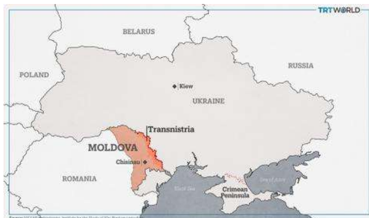
شکل ۳. نقشه موقعیت ترانسنیستریا در شرق مولداوی

ایگور ژوکوا، معاون رئیس دفتر ولودیمیر زلنسکی، با اشاره به مواضع یک مقام ارتش روسیه در خصوص تهاجم به منطقه «ترانسنیستریا» در شرق مولداوی، اعلام کرد: احتمال چنین تهاجمی زیاد است. به گزارش «نیوزویک»، رستم مینکایف، معاون فرمانده منطقه نظامی مرکزی روسیه، جمعه گذشته گفته بود که کرملین بنا دارد به عنوان بخشی از استراتژی ایجاد کریدور زمینی به کریمه، که مسکو در سال ۲۰۱۴ آن را ضمیمه خاک روسیه منطقه جدایی طلب «ترانسنیستریا» در شرق مولداوی را از طریق کریدوری زمینی در جنوب اوکراین به شبه جزیره کریمه متصل کند. اظهاراتی که نشان می‌دهد پوتین بدنبال ایجاد دیوار استراتژیک بین خود و اروپاست و عوامل سیاسی اثرگذار بر بازارها از جمله بازار انرژی را افزایش می‌دهد.