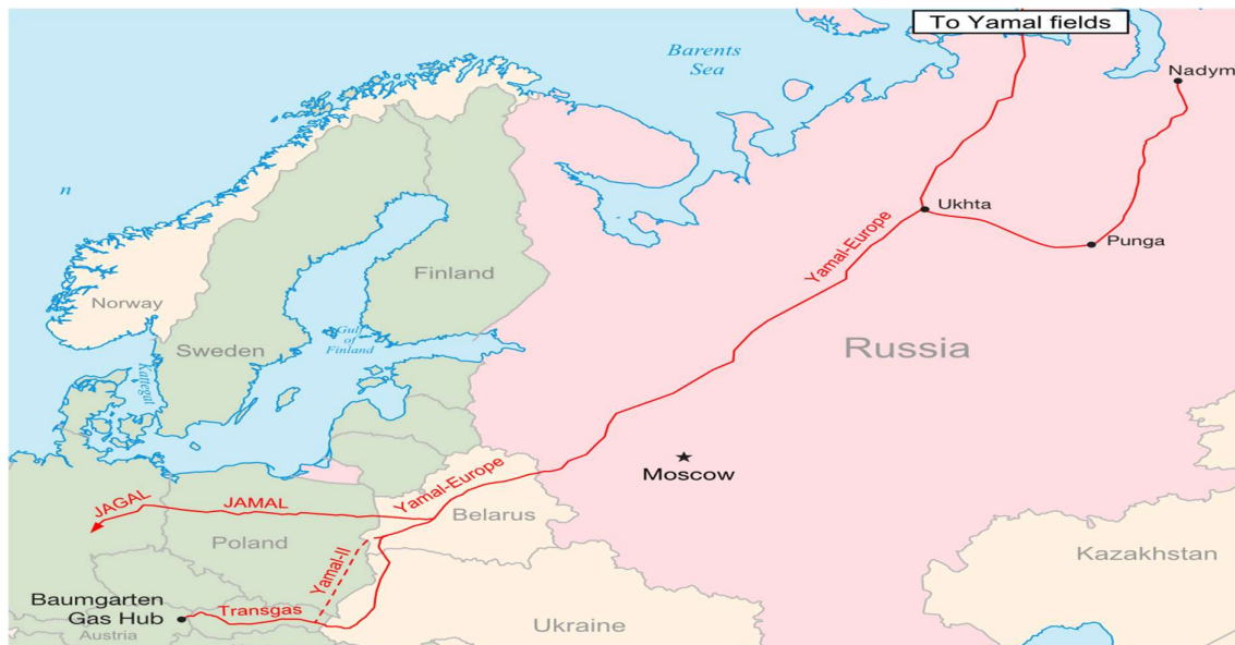
نقشه ۱. خط لوله یامال-اروپا

۶. مهم‌ترین خبر در هفته گذشته، هشدار روسیه مبنی بر توقف صادرات گاز خود به لهستان و بلغارستان در روز سه‌شنبه ۶ اردیبهشت بود و بفاصله یک روز تحقق یافت. شرکت گازپروم که قبل از اشغال اوکراین، انبارهای گاز خود در کشورهای اروپایی را کاهش داده بود، روز چهارشنبه به دلیل تشدید اختلافات گسترده روسیه با غرب بر سر درگیری‌های نظامی مسکو-کی‌یف، اعلام کرد عرضه گاز به لهستان از خط لوله یامال را متوقف می‌کند. این تصمیم تاثیر عوامل سیاسی بر بازار نفت را افزایش داد و قیمت نفت با رشد همراه شد و نه تنها کاهش قیمت نفت در ابتدای هفته را جبران کرد بلکه به منجر به افزایش قیمت نفت در بازه ۷ روزه شد. نقشه ۱ نشان‌دهنده مسیر خط لوله یامال-اروپاست.